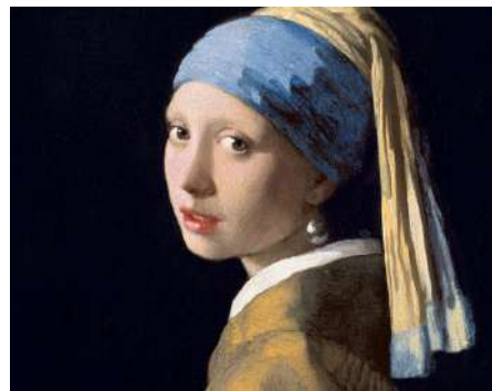
Girl with a Pearl Earring (original) Johannes Vermeer, 1665